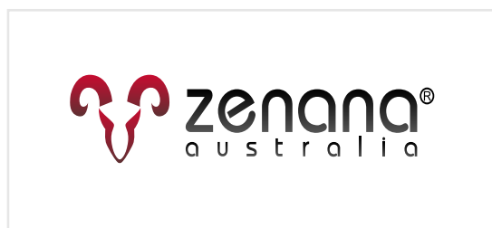
1 Deformacja logo, zmiana proporcji

Pole ochronne określa minimalny obszar przypisany do znaku - to odległość znaku od pola, na którym znak się znajduje. Pole ochronne zabezpiecza znak przed deformacjami jego cech plastycznych i zapewnia dobry odbiór wizualny.