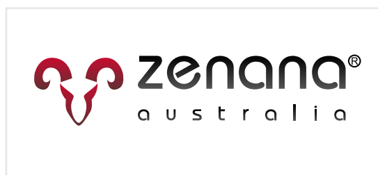
3 Nieodpowienia konstrukcja logo