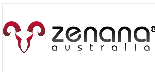
2 Niezachowanie pola ochronnego logo